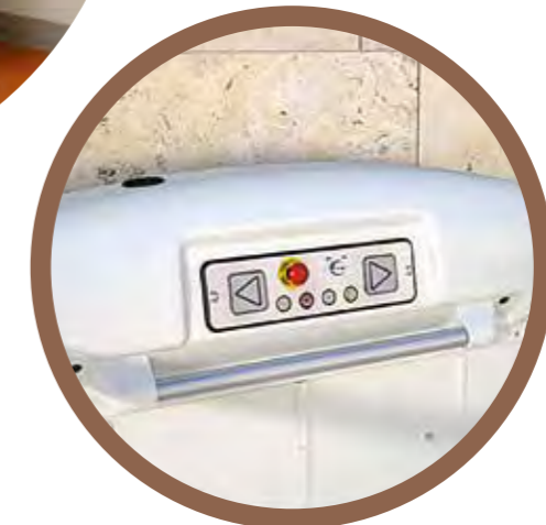
PANEL DE CONTROL INTEGRADO