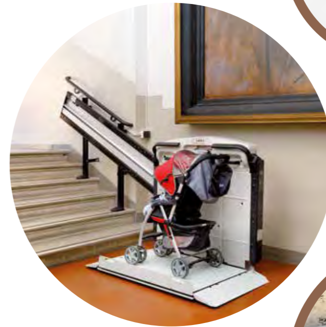
V65 CON BARRAS RETRACTILES