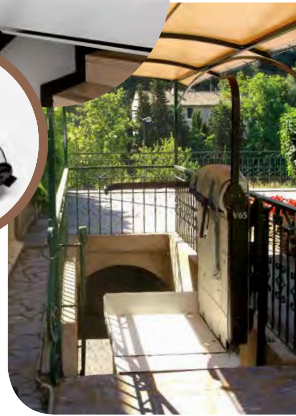
V65 CON BARRAS INDIPENDIENTES